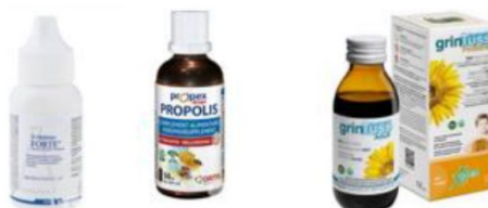
Example 4: Bottles of food supplements

Muussa tapauksessa muovia sisältävä pullo luetaan juomapakkaukseksi ja se kuuluu SUP-direktiivin soveltamisalaan. Jos tällaisessa juomapakkauksessa on lisäksi muovinen korkki tai kansi, sovelletaan myös Art. 6 (1) eli korkin tulee pysyä kiinni juomapakkauksessa sen käyttövaiheen ajan. Samaa ajattelua sovelletaan myös ravintolisinä markkinoitavien limsatyyppisten juomien pakkauksiin (muovia sisältävä pakkaus + muovikorkki).