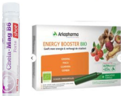
Example 5: "One-shot" ampules of liquid food supplements

Pakkaukset ovat SUP-juomapakkauksia, koska ampullin sisällä oleva neste käytetään yleensä suoraan ampulleista ilman lisälaimennusta.