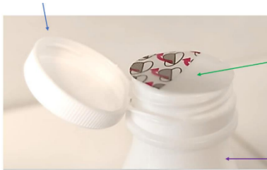
Example 1: SUP beverage container with plastic cap and additional plastic seal

The plastic cap and the seal constitute a two-step closure as listed in Table 4-6 of the Guidelines, which shows illustrative examples of different types of caps, lids and covers: